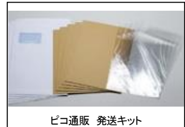
ピコ通販 発送キット

同人誌自家通販に最適化した別売「発送キット」と、「送り状印刷機能」により面倒な宛名書きを省略し高品質な梱包で発送できます。